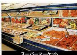
スーパーマーケット

納入先 (抜粋) 敬称省略 国内最大級某テーマパーク(千葉浦安) / USJユニバーサルスタジオジャパン / ハウスデンボス / 那須ハイランドパーク / レゴランド / どんかつ和幸 / かつ丸 / かつ亭 / かつ銀 (にしはるグループ) / どんかつ樓家 / ヤオコー / サンリア / マルショク / サニーマート / スーパーマキヤ / スーパーバード / ジャー・ストアー / スーパーセイブ / ウジエスパー / イトーチェーン / 昭和食品 / 中央フードサービス / JR東日本フードサービス / 日本エアポートデリカ (空弁・羽田空港) / TFK (成田空港) / インフライトフーズ (成田) / 日本メンテナンスサービス (サービスエリア多数) / つばし / ベスカ / あど / 小樽 / ぼ / トマーケット / 波瀾万丈 / ゴー / ゴーカレー / 金あけ牧のうどん / かんなん丸 / 金のどりから / スターキのドン・フォルクス (アークミール) / 阿部蒲鉾店 / Aコープ宮城 / 庄屋フードシステム / はなの舞 (FC) / イタルリアントマト / 名代富士そば / NITファミリーティーズ / NTT都市開発 / 明治サンテオレ / 肉の万世 / 北海道キヨスク / 西武鉄道 / 東武鉄道 / 順天堂医院 / アイデアプラス / 日本レストランエンタプライズ / 野の葡萄 / ほっともっと / ほっかつ / まか亭 / おべんどうの如月 / きょうざの龍 / つばめグリル / HUGE / 雄大 / ニュー加賀屋 / ニュー富士大阪 / ジャパントラベルサービス / シネマシティ / シネプラザサントムーン / 七福の湯 / 大江戸温泉物語 / 天然温泉さぶ〜ん / オーシャンシステム / リーガロイヤルホテル (プリチストンリーガ) / 明治フーズ / 定義どうぶ店 (定義観光) / 極洋食品塩釜工場 (1300&連続フライヤー) / プリマ食品 (2000&連続フライヤー) / セブンイレブン向けデリカ工場 / ファミリーマート向けデリカ工場 / その他各社各店、韓国・台湾・フィリピン等・多数 (順不同)